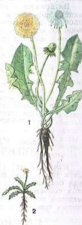
Рис. 44. Изменение размера одуванчика под влиянием условий среды: 1 — выросший на равнине; 2 — выросший в горах

Известно, что количество и качество молока в большой степени зависят от правильности кормления коровы. Но значит ли это, что удой зависит только от кормления? Нет, такой вывод неверен. Известно, что некоторые породы скота дают в обычных условиях в год